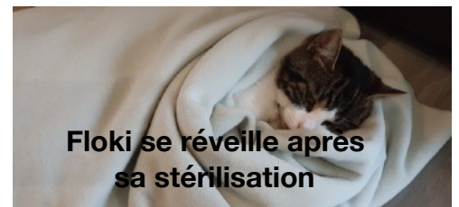
Floki se réveille après sa stérilisation

https://www.facebook.com/ Vetadom-Bretagne- romantique-100241231978798