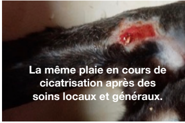
La même plaie en cours de cicatrisation après des soins locaux et généraux.

petite masse est très douloureuse. Dans ce même temps, votre chat peut être grognon, léthargique, présenter une baisse d'appétit, cela, du fait de la fièvre souvent associée et de la douleur.