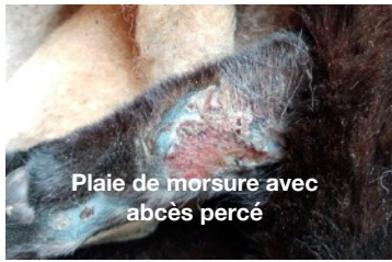
Plaie de morsure avec abcès percé