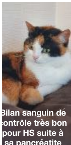
Bilan sanguin de contrôle très bon pour HS suite à sa pancréatite

Quel est le traitement ? Suivant la sévérité et les symptômes, le vétérinaire adapte le traitement : soulager la douleur, arrêter les vomissements, prévenir les infections secondaires, réhydrater, ... L'hospitalisation est le plus souvent nécessaire. C'est une maladie grave qui peut être fatale si elle est non correctement prise en charge.