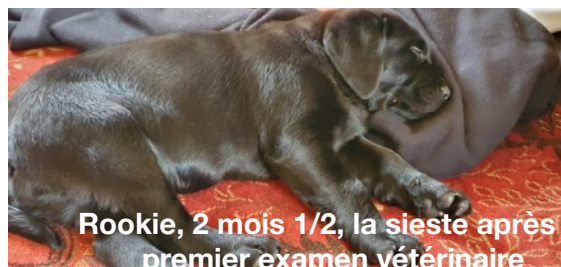
Rookie, 2 mois 1/2, la sieste après premier examen vétérinaire

Les antiparasitaires externes : Les parasites externes sont globalement tous les parasites qui vivent sur l'extérieur de l'animal, dans le pelage ou sur ou dans la peau, ... (puces, tiques, agents des gales, ...). Il existe différents moyens de lutter contre eux : collier, pipettes, comprimés, spray ; en fonction du traitement